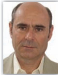
Μάγος Ευστάθιος Μηχανολόγος Μηχανικός Αυτίων